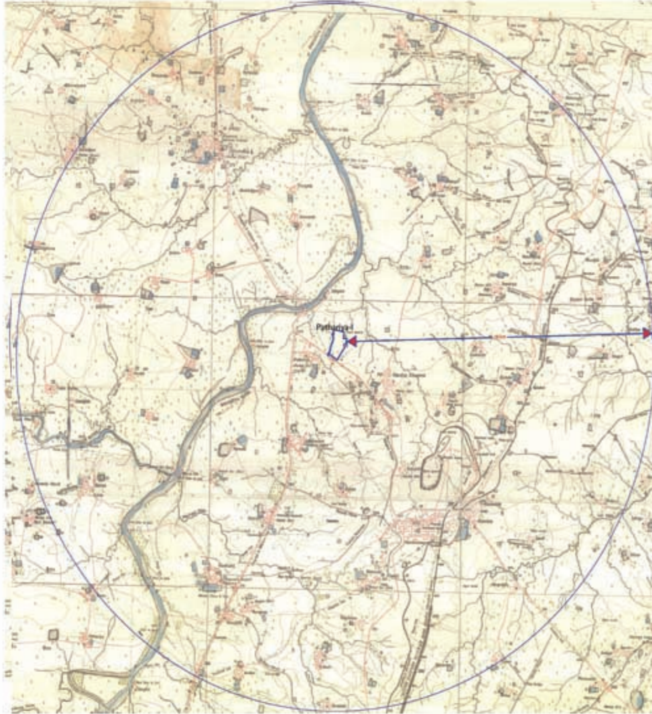
Map showing Mine Site & Surrounding Features